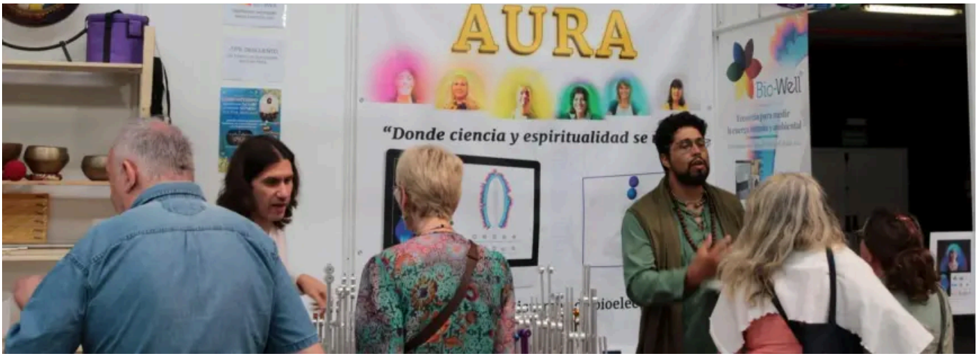
Puesto de empresas que promocionan pseudoterapias en el BioCultura de Barcelona CR • Barcelona

Según el color, uno puede conocer el estado de sus chakras gracias a la visualización de una fotografía Kirlian —una técnica que ha sido utilizada para captar fenómenos paranormales, rechazados por la comunidad científica—. "Esto se traduce en el estado de los órganos, cuál es tu rasgo psicológico fundamental y, claro, cómo podemos mejorarlo, ya que así sabemos qué patrón psicológico o emocional podemos corregir para que la energía circule por donde no circula ", explica.